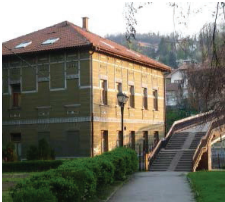
Prilog 4. Kuća Sead-bega Kulovića u Tuzli. 36

Kuća Sead-bega Kulovića kod „Plavog mosta” u Tuzli i danas svjedoči o tragičnoj sudbini porodice Kulović. Osim kuće, na Sead-bega Kulovića dugo vremena je podsjećala i ulica koja je u Tuzli nosila njegovo ime. 34 Pa i sama ta činjenica govori u prilog konstataciji da presuda o „krivnji” Sead-bega Kulovića ne nudi dovoljno uvjerljivih činjenica, koje upućuju na zaključak da je isti bio državni neprijatelj, te stoga ovo pitanje traži detaljnije obrazloženje, za koje su neophodni dodatni izvori prvoga reda.” U suprotnom, antifašistička Tuzla sasvim sigurno ne bi dala naziv ulice nekom „ideološkom fašisti”, kako je okarakterisan u optužnici. 35