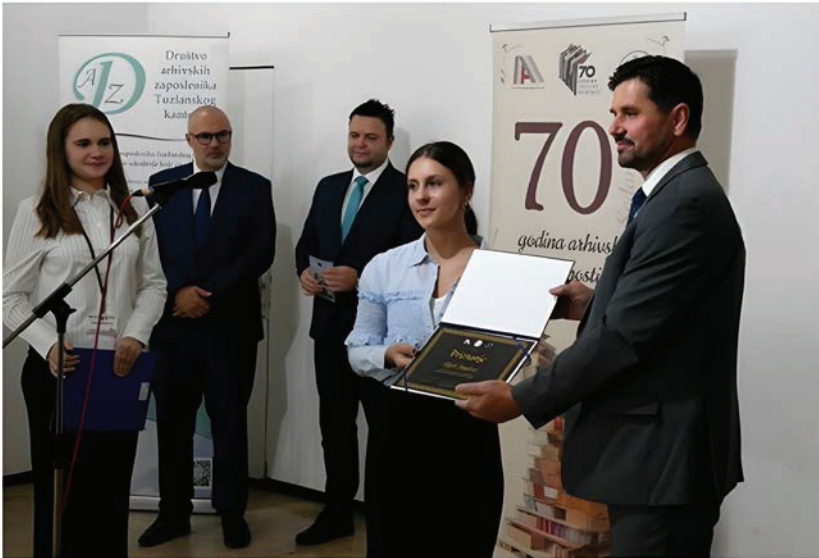
Prilog 3. Dodjela priznanja učenicima na otvaranju izložbe “Biseri tuzlanske arhitekture”, Tuzla, 25.9.2024.

U kontekstu posvećivanja pažnje učenicima i njihovog angažmana Arhiv Tuzlanskog kantona je u 2023. i 2024. godini u saradnji sa Društvom arhivskih zaposlenika Tuzlanskog kantona i Mješovitom srednjom Građevinsko-geodetskom školom Tuzla u okviru manifestacija “Dani europskog naslijeđa” i “Ljeto u Tuzli” pripremili izložbu pod nazivom “Biseri tuzlanske arhitekture”. Na izložbi su predstavljeni panoji i makete značajnih tuzlanskih sakralnih, kulturnih i obrazovnih objekata koji su predstavljanjem pred publikom „oživjeli“ na jedan nezaboravan način. Izložba predstavlja bogatu arhitektonsku baštinu grada, uglavnom iz osmanskog i austrougarskog perioda. Izložbeni panoji i makete detaljno prikazuju neke od najpoznatijih i najznačajnijih građevinskih objekata u Tuzli, koji čine bitan dio kulturnog identiteta grada. 8