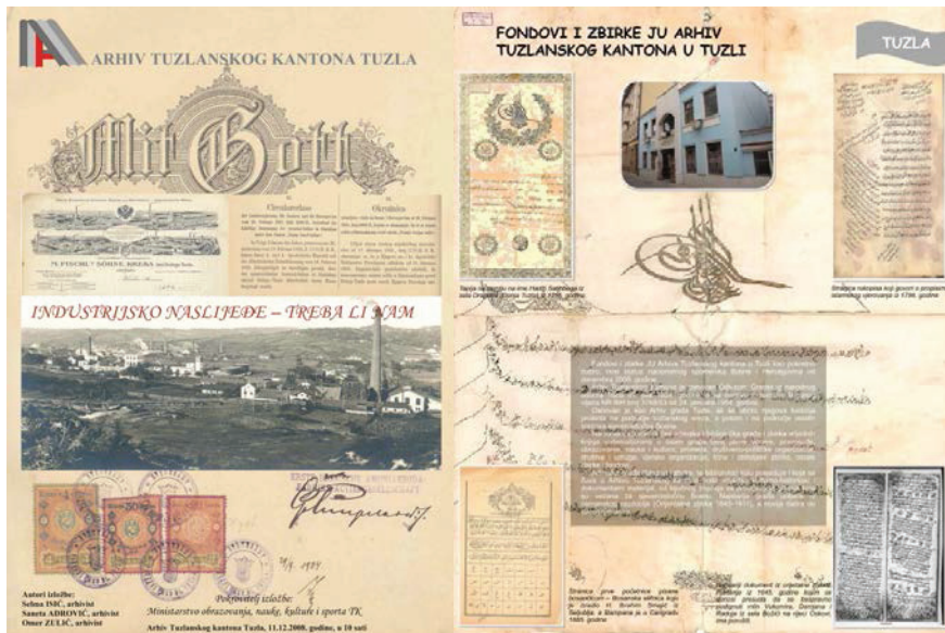
Prilog 1. Plakati izložbi: “Industrijsko naslijeđe – treba li nam (2008) i “Fondovi i zbirke JU Arhiva Tuzlanskog kantona” (2018).

Izložbe su sastavni dio stručnih aktivnosti Arhiva pomoću kojih pobliže upoznajemo javnost sa sadržajem arhivske građe (u ovom slučaju arhivskih fondova i zbirki) koji se nalaze u Arhivu Tuzlanskog kantona. Na taj način potiče se interes javnosti za njihovo korištenje. 4