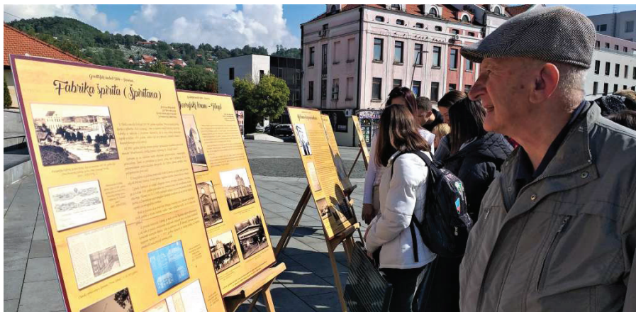
Prilog 2. Izložba Graditeljski simboli Tuzle postavljena na Trgu slobode u povodu obilježavanja “Dana europskog naslijeđa” (2022).

Izložbe arhivskih dokumenata jedan su od značajnijih vidova popularisanja arhivske djelatnosti i kulturno-obrazovnog djelovanja arhiva. 5 Izložbena aktivnost arhiva je od početnih kratkotrajnih, periodičnih, opštih i nepokretnih izložbi, prerasla u intenzivnu izložbenu aktivnost gdje osim već navedenih dominiraju tematske, pedagoške, trajno aktivne, odnosno stalne postavke izložbi, zatim pokretne izložbe, koje izlaze van okvira ne samo lokalne zajednice, nego i države. 6 Značajno je zapaziti da se od početnih tema izložbi koje su se odnosile na određene političke i historijske događaje te istaknute ličnosti, arhivi orjentišu na suptilnije sadržaje koji se tematski odnose na konkretnija pitanja prezentacije arhivske građe, poput planskog predstavljanja