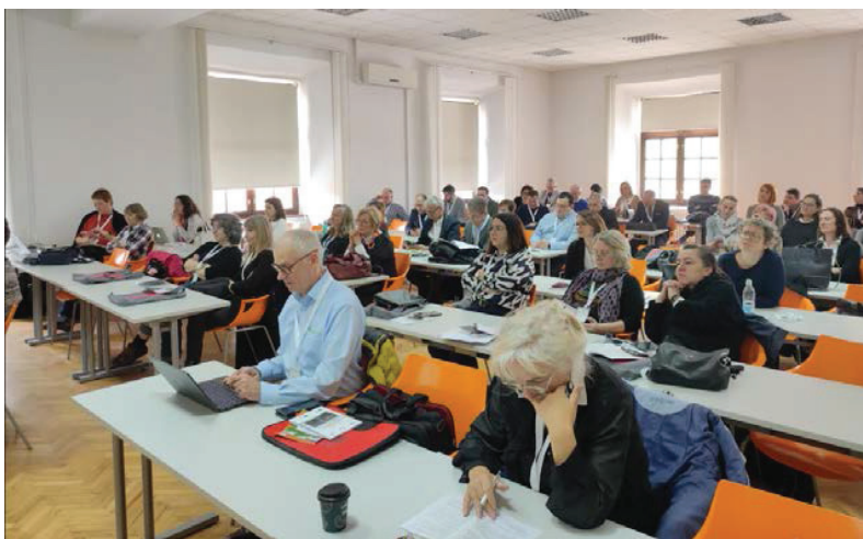
Prilog 2. Učesnici skupa „9. dani ICARUS Hrvatska“.

Organizatori su osmislili bogat trodnevni program u kojemu je sudjelovalo oko 140 izlagača. Njihove teme obuhvaćale su područja kulturnih i kreativnih industrija, uključujući arhive, knjižnice, muzeje, novine i topoteke, kao i rasprave o razvoju publike, digitalizaciji, medijima, migracijama i obrazovanju. Na skupu su predstavljeni međunarodni projekti i inicijative usmjerene na istraživanje kreativnih mogućnosti te suradničke pristupe u komunikaciji kulturne i povijesne baštine, s posebnim naglaskom na program Kreativne Europe, razvoj publike i primjenu digitalnih alata u baštinskim institucijama.