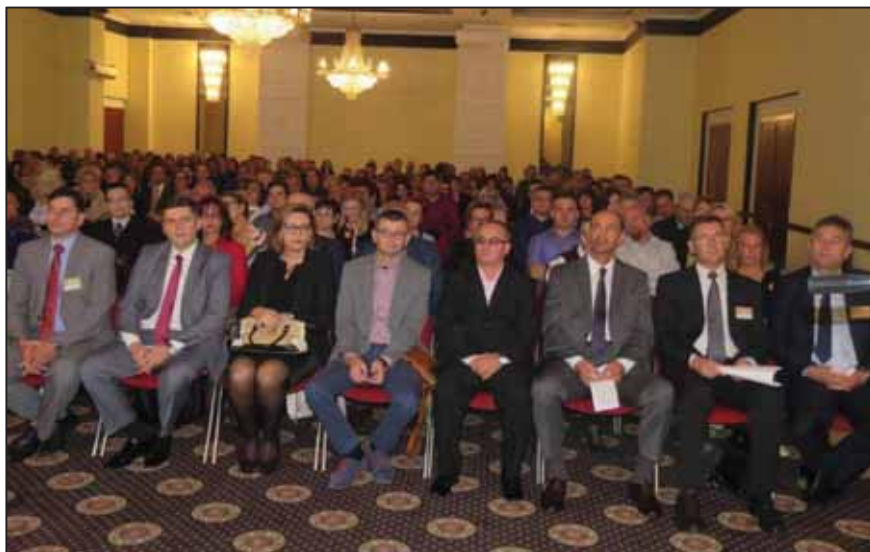
Prilog 1. Sa otvaranja 30. međunarodnog savjetovanja „Arhivska praksa”, 2017. godina.

i šireg okruženja, kako bi se omogućio protok arhivističkog znanja i iskustva prije svega iz zemalja jugoistočne Evrope. Projekat je i danas prepoznatljiv u regiji, posebno po brojnosti uključenih arhivara u isti (u prosjeku oko 200 učesnika po savjetovanju). Najčešće je bio jedini edukativni sadržaj na godišnjem nivou kojem su zaposlenici registratura u Tuzlanskom kantonu imali pristup, a koji je ujedno bio i usmjeren na edukaciju arhivskih radnika u registraturama i unapređenju zaštite arhivske građe u nastajanju. 5