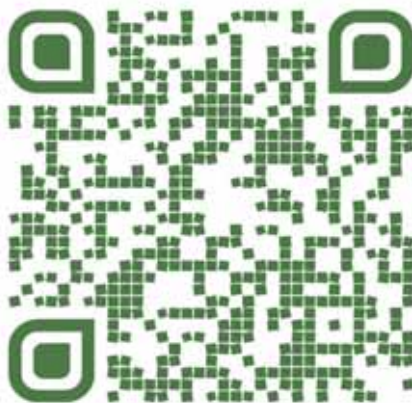
Video prilog RTV TK sa otvaranja konferencije "2. Tuzlanski arhivski dani"

Fokus do sada održanih konferencija „Tuzlanski arhivski dani” bio je na temama posvećenim elektronskim zapisima, elektronskoj građi (5 izlaganja), te arhivima i arhivskoj građi u vanrednim okolnostima (7 izlaganja). To je naravno i očekivano budući da je konferencija koncipirana na način da se jednom stručnom pitanju posveti cijeli radni dio konferencije (iako u manjem broju učestvuju i izlagači sa drugim aktuelnim temama iz arhivske teorije i prakse). Ostatak tema bavi se vrednovanjem građe i arhivskim standardima, arhivistikom i informacijskim tehnologijama i ostalim pitanjima arhivske teorije i prakse.