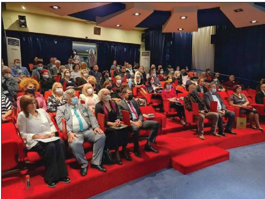
Прилог 3. Учесници Међународног архивистичког саветовања „Нови Сад 2021“.